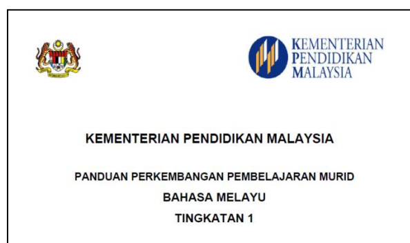
Rajah 1: Panduan Perkembangan Pembelajaran Murid

Panduan Perkembangan Pembelajaran Murid (PPPM) merupakan dokumen yang digunakan oleh guru sebagai panduan untuk memberi penerangan asas penguasaan berdasarkan hasrat kurikulum semasa melaksanakan pentaksiran ke atas murid bagi kemahiran membaca, menulis, lisan. PPPM juga sebagai alat sokongan semasa pengajaran dan pembelajaran secara berterusan. PPPM mempunyai enam aras penguasaan daripada band satu yang terendah dan band enam yang tertinggi selaras dengan hasil pembelajaran yang dihasratkan oleh kurikulum (KPM, 2014). PPPM merupakan penambahbaikan kepada Dokumen Standard Prestasi (DSP) yang digunakan semenjak PBS dilaksanakan pada tahun 2012. DSP mengandungi terlalu banyak evidens bagi setiap mata pelajaran dan menyebabkan kesukaran kepada guru untuk melengkapkan pentaksiran. Oleh yang demikian, PPPM telah mula diguna pakai pada tahun 2014 dan mengandungi enam deskriptor bagi setiap kemahiran bahasa bagi mata pelajaran bahasa Melayu.