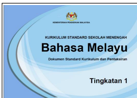
Rajah 3: Dokumen Standard Kurikulum dan Pentaksiran (Sumber: Kementerian Pelajaran Malaysia, 2016)

Tujuan DSKP ini diwujudkan adalah untuk membantu memudahkan guru melaksanakan pentaksiran dalam proses PdP. Semasa proses PdP dan pentaksiran, guru hanya perlu merujuk kepada DSKP sahaja. Melalui kurikulum baharu ini, guru akan mentaksir perkembangan dan pencapaian murid melalui Standard Pembelajaran. Standard pembelajaran adalah suatu penetapan kriteria atau indikator kualiti pembelajaran dan pencapaian yang boleh diukur bagi setiap standard kandungan.